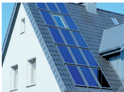
Dach Solar Velux